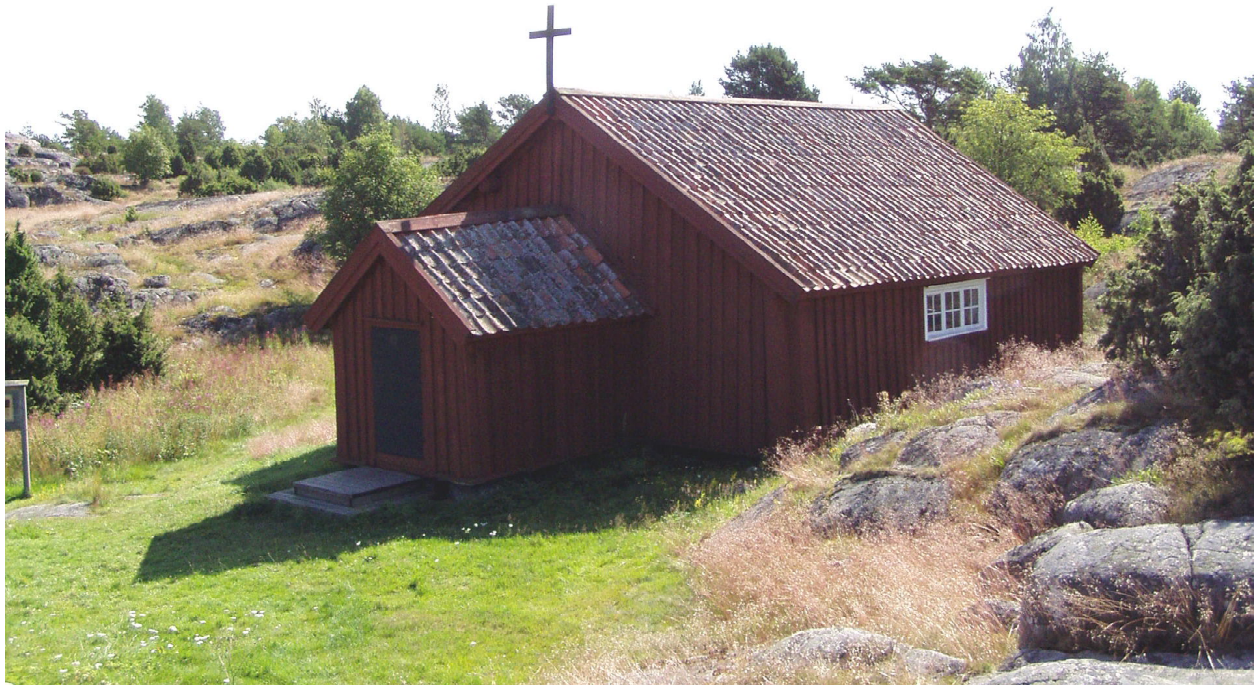
Väderskärs kapell i den lågt stående solen på morgonen den 28 juli 2004