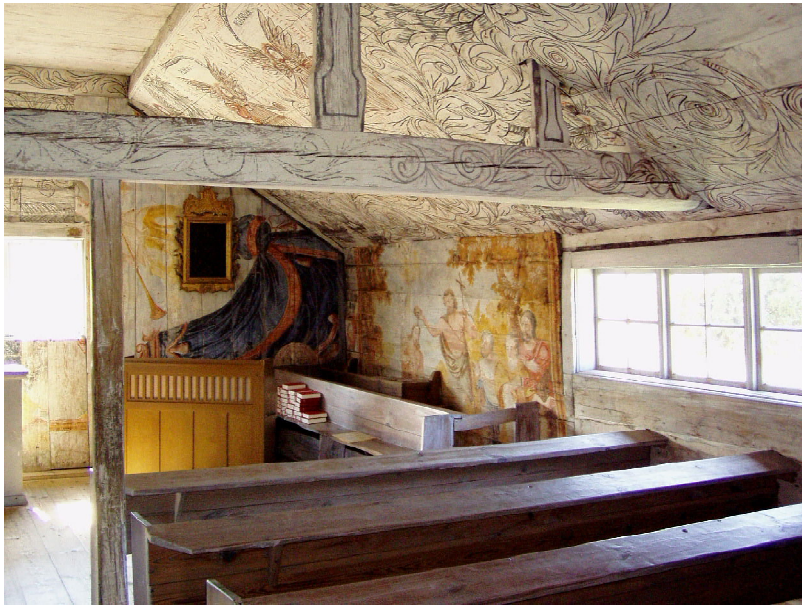
Interiörbilder från Väderskärs kapell