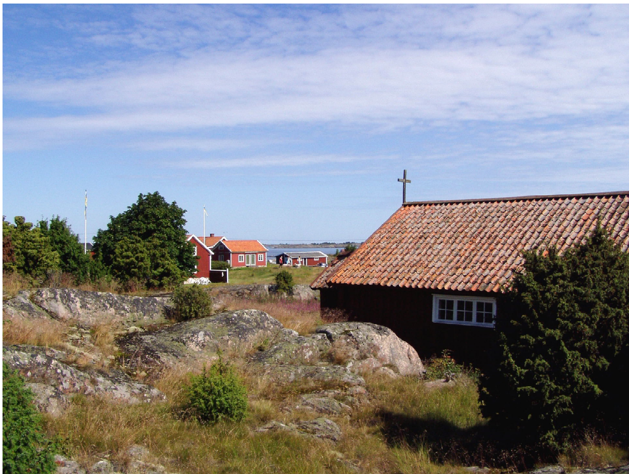
Väderskärs kapell från sydost - med byn i bakgrunden