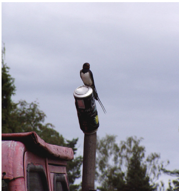
Ladusvalan på traktorns avgasrör - på en ciderburk...

benådat midsommarfirande för många år sedan, då barnen var små. Även här upplever vi det som om vi bara varit borta några dagar – trots att det nu är ett helt år sedan vi var här senast. Vi känner ju igen varje hus, nästan varje sten och knotig rot på stigen bort mot Turess Udde och tjärnen med de röda näckrosorna, och ett visst vemod smyger sig in i våra sinnen, när vi undrar hur många fler gånger vi skall komma att besöka Harstena. Ett människoliv är ju ack så kort!