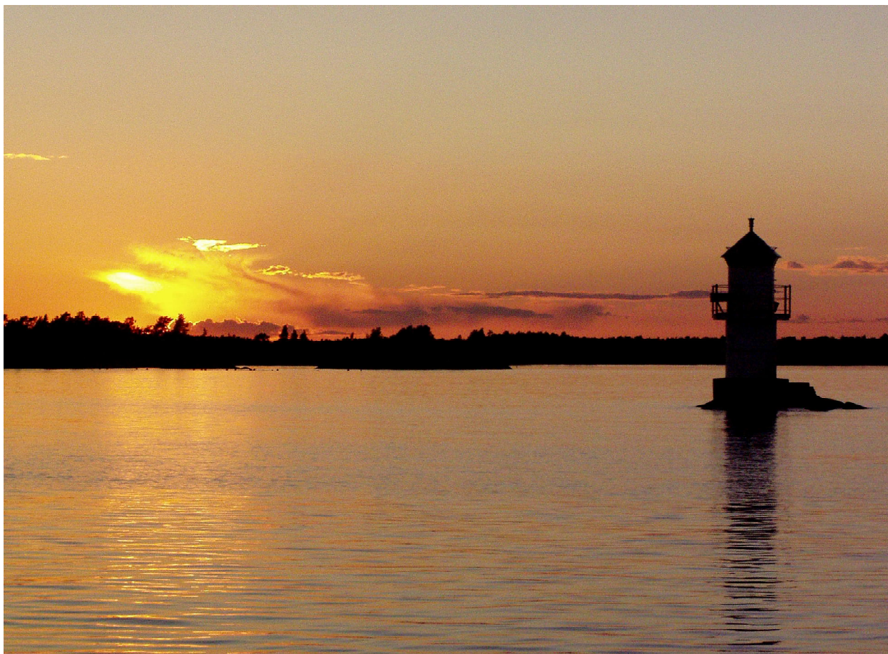
På kvällen upplevde vi en fantastisk solnedgång vid Väderskär

I en text från Kalmar Läns Museum kan man för övrigt om ön läsa följande: "De magra omständigheterna till trots ökade befolkningen även på Väderskär successivt. År 1779 fanns totalt 21 personer på ön. Något måste ha hänt åren därefter, för 1813 redovisas 99 personer totalt. Därefter sjunker siffrorna sakta men säkert, för att vid sekelskiftet 1900 räkna ca 50 personer" .