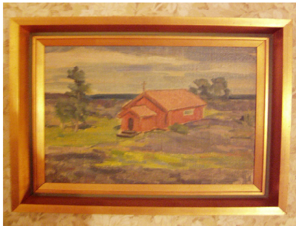
Väderskärs kapell på Ernst Leonards tavla...

korta sträckan in mot stranden. När vi sitter ner i jollen ser vi inte längre kapellet, men vi har ju ändå en föreställning om riktningen dit. Vi landar med visst besvär vid några klippor och startar sedan en ganska mödosam vandring genom tät vegetation upp mot de centralare delarna av ön. Själva byn har vi till vänster om oss, och till sist kommer vi in på en mer lättframkomlig stig, som efter hand leder oss till själva kapellet. Nästan andaktsfullt står vi plötsligt där. Kapellet är märkligt anspråkslöst och smälter väl in i den karga miljön.